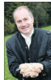
Die Reformpartnerschaft ermöglicht wieder die Förderung von Biomasseheizanlagen.

Landesrat Johann Seitinger erwirkt Fördermöglichkeiten für Biomasseheizungen bis 2014 und betont gute Reformpartnerschaft.