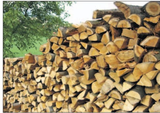
Der nachwachsende Rohstoff Holz ist eine der besonderen heimischen Energiequellen. Die Steiermark ist beim Einsatz erneuerbarer Energie führend.

Ob auf einer Almhütte, im traditionellen Wirtshaus oder im Haubenrestaurant – Österreichs Gastronomen setzen beim Lebensmitteleinkauf auf heimische Qualität. Bereits 1300 Gastronomiebetriebe wurden bisher bundesweit mit dem AMA-GastroSiegel zertifiziert. Der Wunsch nach Regionalität steigt einerseits beim Einkauf für zu Hause, denn laut jüngsten Umfragen ist die regionale Herkunft für 84 Prozent der Konsumenten das wichtigste Kaufkriterium. Andererseits spürt man diesen Trend auch in der Gastronomie – und dies sowohl bei den Gästen als auch bei den Gastwirten.